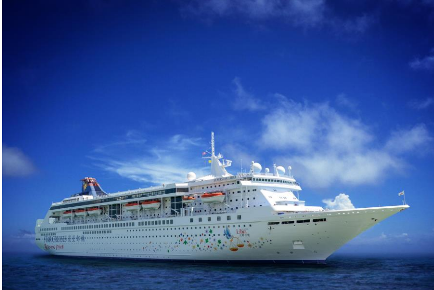
丽星邮轮「天秤星号」于9月22日回归马来西亚并以槟城为母港。