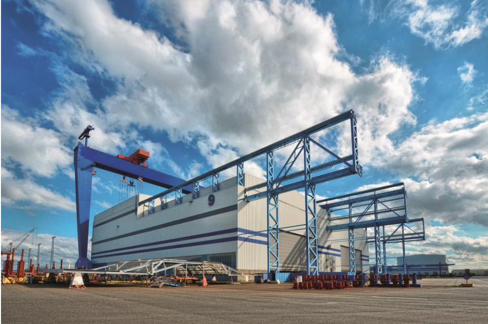
Nordic Yards 瓦讷慕德船厂

(于百慕大持续经营的有限公司 - 注册编号 29337) (前称 丽星邮轮有限公司)